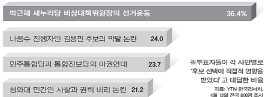
주요 사안별 총선에서 후보 선택에 미친 영향 평가 단위: %, 총선 투표자 기준.

: http://news.chosun.com/site/data/html_dir/2012/04/14/